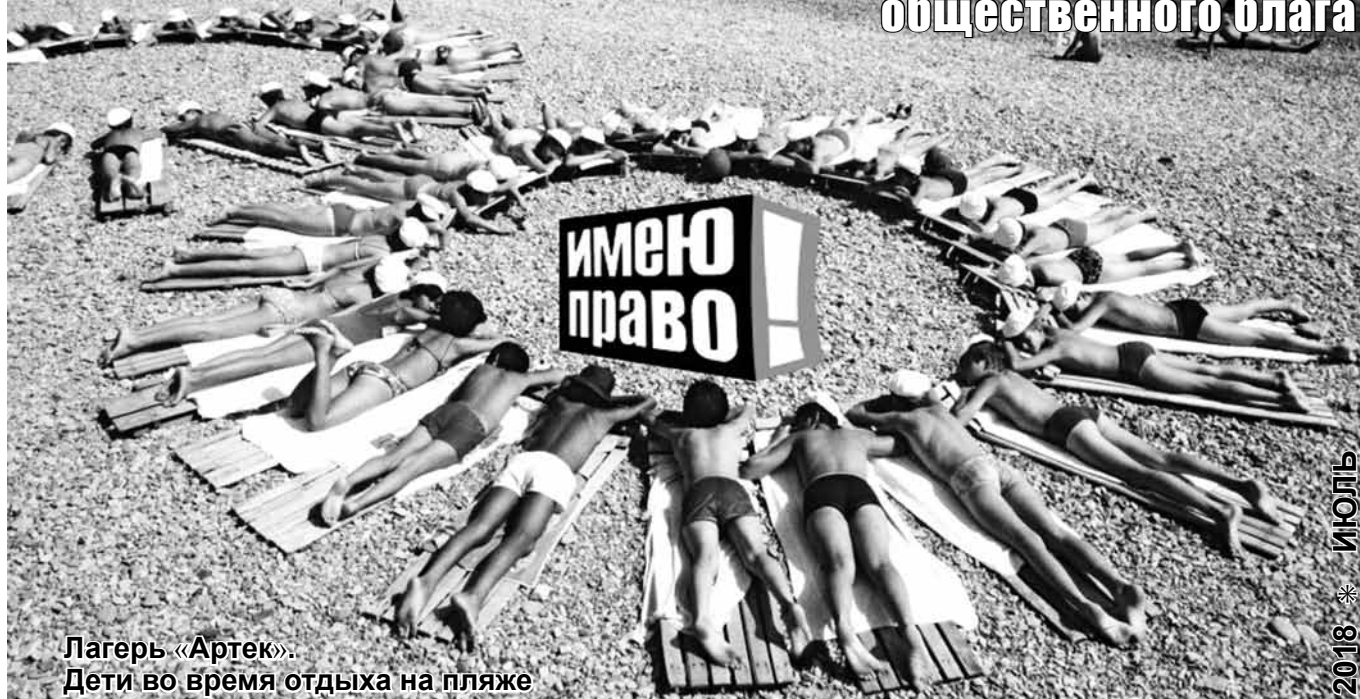
Лагерь «Артек». Дети во время отдыха на пляже

Мы делаем юридические знания и осведомленность в правовой сфере доступными широкому кругу лиц ради общественного блага